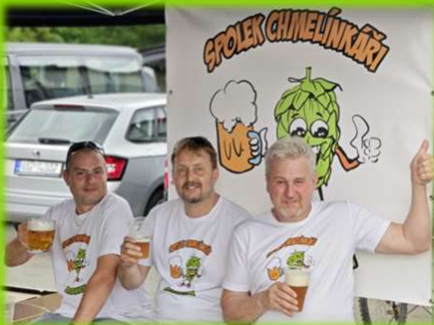
Foto z hodových oslav

PŘEJEME VÁM HEZKÝ ZBYTEK LÉTA PLNÝ SLUNCE, POHODY A RADOSTI