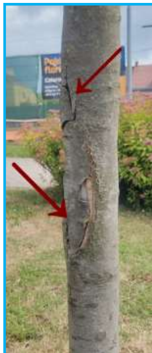
Poškozený kmen magnolie

Prosím, všimněte si svých, ale i ostatních dětí, jak se k zeleni chovají. Upozorněte je, když strom poškozují, vysvětlete jim, co tím mohou způsobit. Neopírejte, prosím, kola o mladé stromy. V parku je dostatek stojanů. Jak budeme k našemu parku přistupovat dnes, tak bude vypadat v dalších letech.