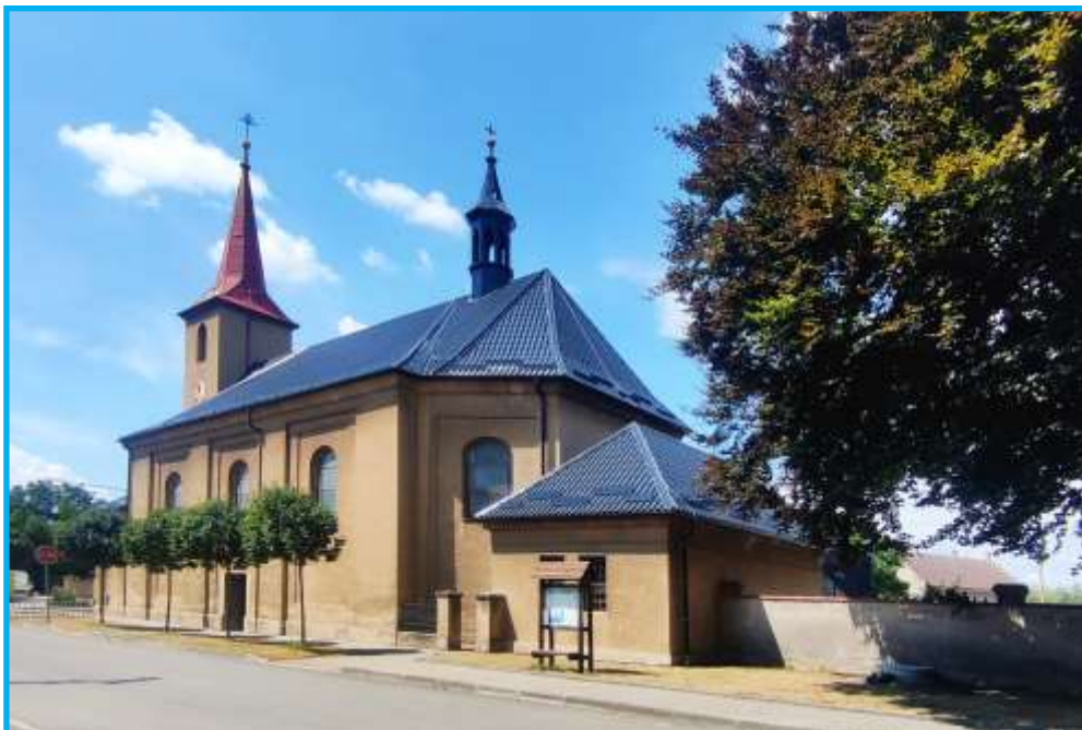
Pohled na kostel od obecní stodoly 14. července 2023

- Henčlov 100.000,- Kč, Anděl Přerov s.r.o. 100.000,- Kč, Hanácká potravinářská společnost s r.o. Olomouc (Cukrovar Prosenice) 50.000 Kč, ostatní dárci 230.000,- Kč, dluh farnosti je ve výši 250.000,- Kč.