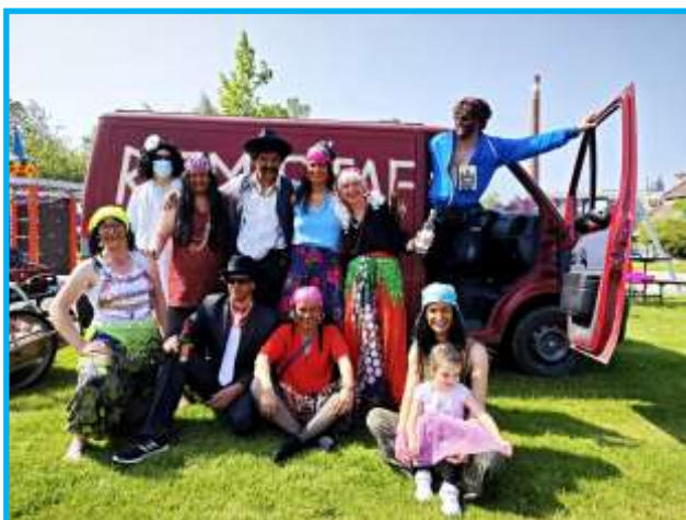
Ochotní ochotníci ze scény se skácením májky

Přestože řádně foukalo a po západu sluníčka se notně ochladilo, nikdo nezmrzl a mnozí vydrželi až do pozdních nočních hodin. Když je dobrá zábava, ani počasí nemůže odradit.