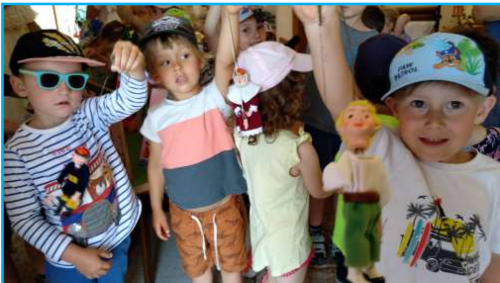
Děti na výstavě loutek Z pohádky do pohádky

Je čas prázdnin a muzejní sezóna je v plném proudu. V dubnu skončila velko-noční výstava, která byla již tradičně hojně navštěvovaná, přišlo 350 lidí. Mezi nimi i mnoho dětí, které si mohly v dílničkách nazdobit vajíčka různými technikami. Oficiální muzejní sezónu jsme pak zahájili 21. května, a to výstavou loutek Loutkového divadla Kašpárek TJ Sokola Přerov.