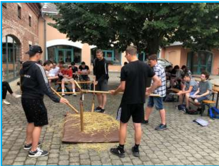
Studenti SPŠ Přerov při cepování v muzeu

do konce října) máme otevřeno pravidelně každou neděli odpoledne od 14.00 do 17.00 hod. V zimních měsících není řádná sezóna, ale pokud nám to bude umožněno a budeme v tom podpořeni, uděláme výstavu vánoční a velikonoční. Otevírací doba se bude řídit informacemi na vývěskách. Větší skupinky návštěvníků se mohou přihlásit k prohlídce muzea i v jiný libovolný termín, vždy dle domluvy.