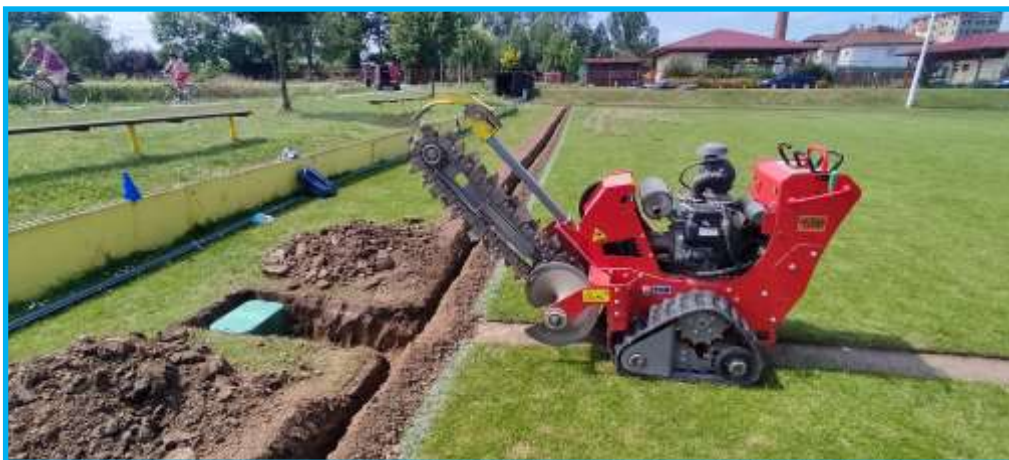
Snímek z budování závlahy

Sen se stal skutečností a na hřišti v Prosenicích můžete od začátku prázdnin sledovat, jak vyjíždí automatické zavlažování. Projekt se podařilo po několika letech konečně dotáhnout do konce. Díky velmi rychlé a kvalitní práci firmy Barset s.r.o. se výkopové práce, instalace nových čerpadel, rozvod závlahy i zahlazovací činnosti podařilo i ve spolupráci s našimi fotbalisty stihnout oproti původním předpokladům o 14 dní dříve. Tato investice do zavlažování bude mít poměrně rychlou návratnost vzhledem ke kvalitnímu hracímu povrchu a zejména podstatně nižší spotřebě vody. Úspora vody oproti běžným přenosným zařízením by měla dosáhnout až 60 %. Výhodou je i jednoduchá obsluha a hlavně už žádné neustálé přenášení postřikovačů, jak jsme byli po celé ty roky zvyklí. Po předání díla členové Sokola nezaháleli a potřebná sušší místa oseli travním semenem, hřiště postříkali proti plevelům, pohnojili, srovnali a připravili na novou sezónu, která začíná již v srpnu.