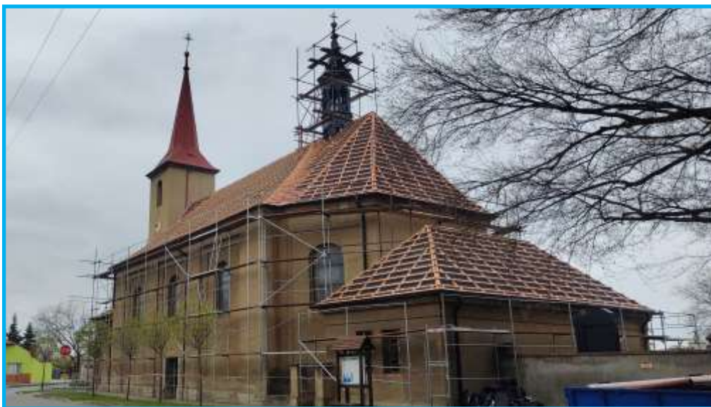
Pohled na kostel od obecní stodoly 29. dubna 2023

Od 17. 4. do 11. 5. 2023 probíhala oprava střechy kostela svatého Jana Křtitele a svatého Antonína Paduánského v Prosenicích, a to vyjma hlavní věže, která bude opravena později. Opravu provedla firma pana Pavla Gadase, Mlýnská 515, 751 14 Dřevohostice. Plechová pozinkovaná krytina z roku 1962 byla vyměněna za krytinu z ocelového plechu s povrchovými ochrannými vrstvami od firmy LINDAB SALES CZ s.r.o. Praha – výrobní Hustopeče. Vybrána byla černá barva, která se nachází i na okolních střechách. Malá věž byla natřena. Při opravě byly rovněž vyměněny ztrouchnivělé dřevěné trámce zakončující střechu ze strany od hřbitova. Dále byly zdvojeny trámy u hlavní věže a na lomu střechy pod malou věží. Pod plech byla natažena difúzní fólie a bylo provedeno odvětrání střechy. Současně byly nainstalovány nové okapy a nový hromosvod. Staré i nové dřevo bylo oboustranně ošetřeno nastříkáním ochranného prostředku Optimal.