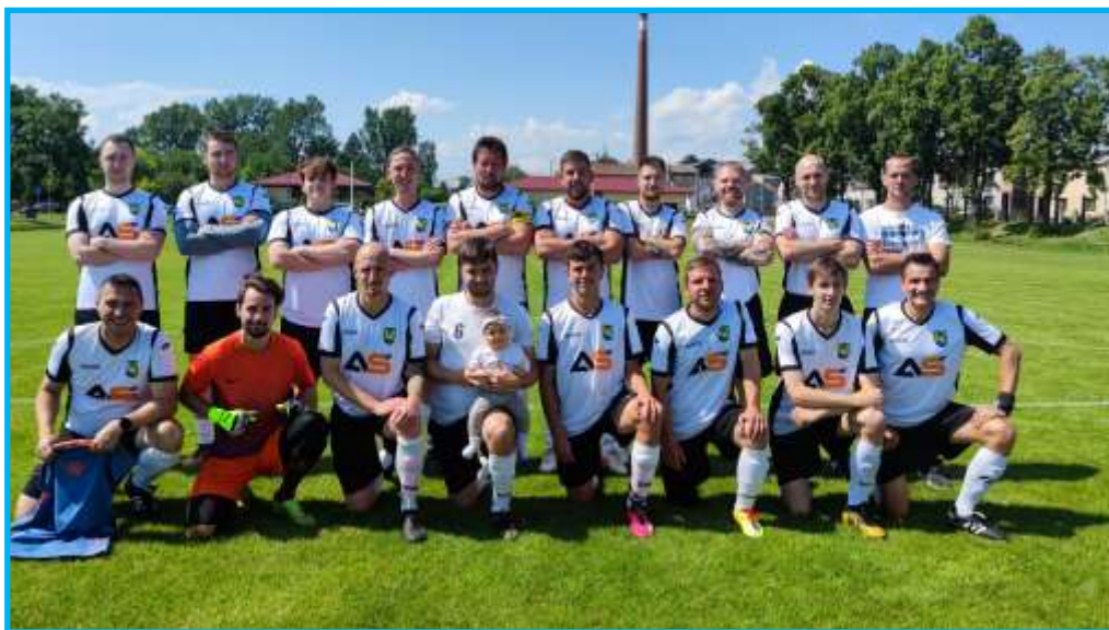
Muži – okresní přebor Radslavice B