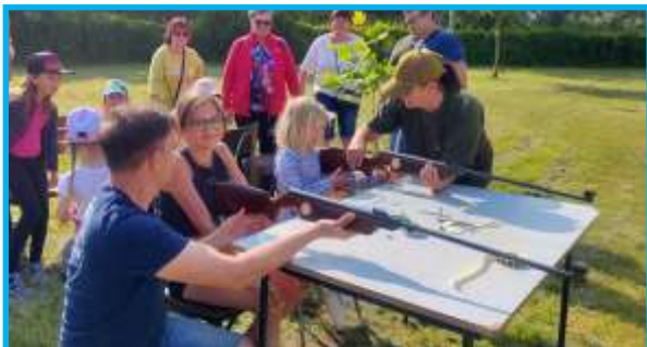
Střelba v mysliveckém koutku

Tato akce z konce května byla vždy vyhledávána výhradně místními občany. Pochopitelně. Vždyť májku v tomto termínu kácí všechny obce v okolí. Letošní rok však tuto zvyklost změnil.