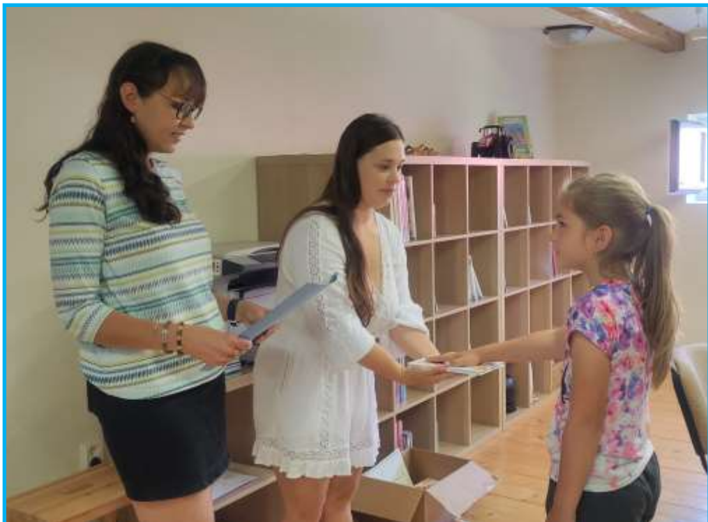
Pasování prvňáčků na čtenáře v dětském oddělení knihovny.

Čtenáři, kteří k nám do knihovny zavítají, jistě ocení velký výběr knih. Jsme schopni zajistit výpůjčku i z jiných knihoven. Stačí jen přijít a vybírat. Po dobu letních prázdnin je knihovna otevřena vždy ve středu od 16:30 do 20:00. Od září pak opět v obvyklé výpůjční hodiny, a to v pondělí od 16.30 do 19.30 a ve středu od 16.30 do 19.00.